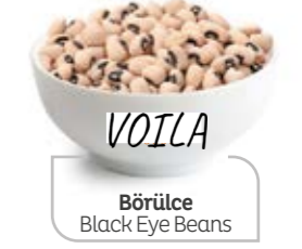
Börülce Black Eye Beans