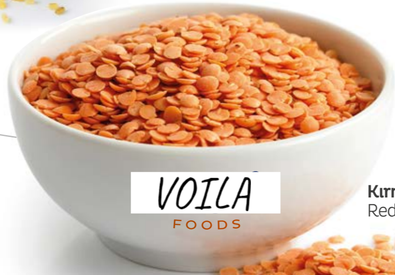
Kırmızı Mercimek Red Lentils