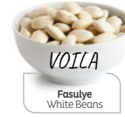
Fasulye White Beans