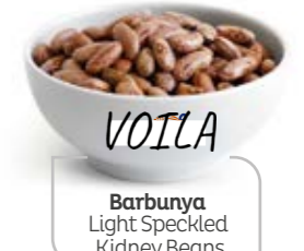
Barbunya Light Speckled Kidney Beans