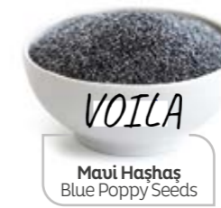
Mavi Havaş Blue Poppy Seeds