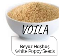
Beyaz Havaş White Poppy Seeds