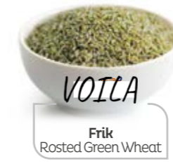
Frik Rosted Green Wheat