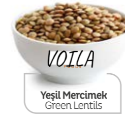
Yeşil Mercimek Green Lentils