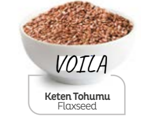
Keten Tohumu Flaxseed