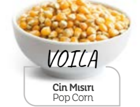
Cin Mısırlı Pop Corn