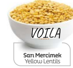
Sarı Mercimek Yellow Lentils