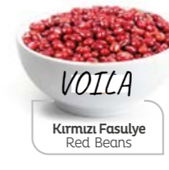
Kırmızı Fasulye Red Beans