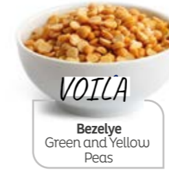
Bezelye Green and Yellow Peas