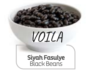
Siyah Fasulye Black Beans