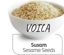
Susam Sesame Seeds