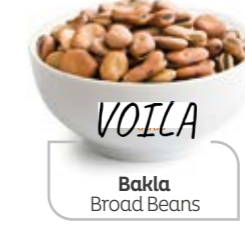
Bakla Broad Beans