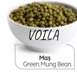
Maş Green Mung Bean