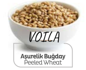
Aşurelik Buğday Peeled Wheat